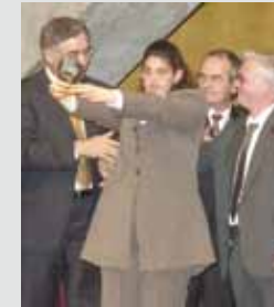
Huelva Junta. 2002