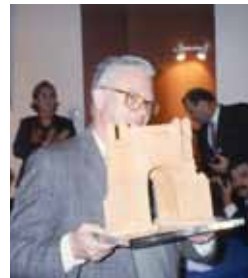
Galardón Tertulia Cultural Sevillana Molviedro. 1996