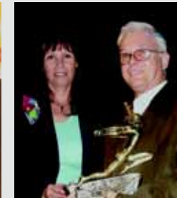
Premio de Buenas prácticas. Junta de Andalucía. 2006