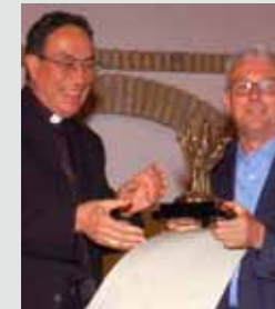
Fundación Social Universal. Montilla 2005