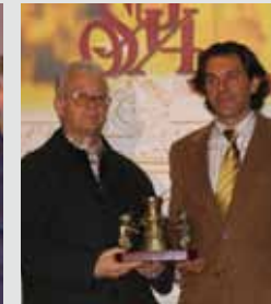
Ursonés del Año. Osuna. 2006