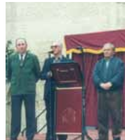
Medalla de Plata del Ayuntamiento de Santiponce. 2000