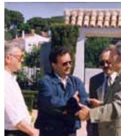
Alcalareño del Año 1990