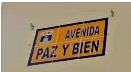
El Ayuntamiento de Cortegana, reconoce de esta manera el impulso socioeconómico que han supuesto para la comunidad la presencia de Paz y Bien. 2014