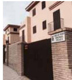
Calle dedicada por el Ayuntamiento de Santiponce.