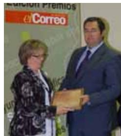
I Premio "El Correo de Andalucía". 2007