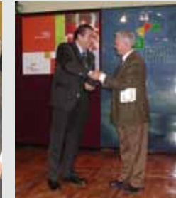
Aljarafe Empresa- rial. 2002