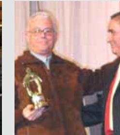
CANF de oro. 2005