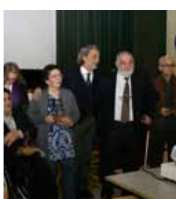
Vicasti de honor. Villanueva de los castillejos (Huelva). 2011