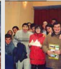
Serrano del Año (Huelva). 2003