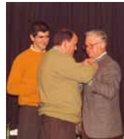
Pero de Oro del Ayuntamiento de Galaroza. 1999