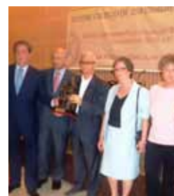
San Juan de Dios. Colegio de Enfermería de Sevilla. 2012