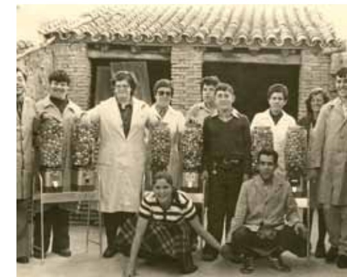
Foto 1. Entrega de la Finca San Buenaventura a Paz y Bien. Foto 2. Primeras fregonas Pepita. Foto 3. En esta casa prestada nació Paz y Bien. Enero 1969.