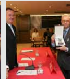
Fundación Mapfre medicina. 2005