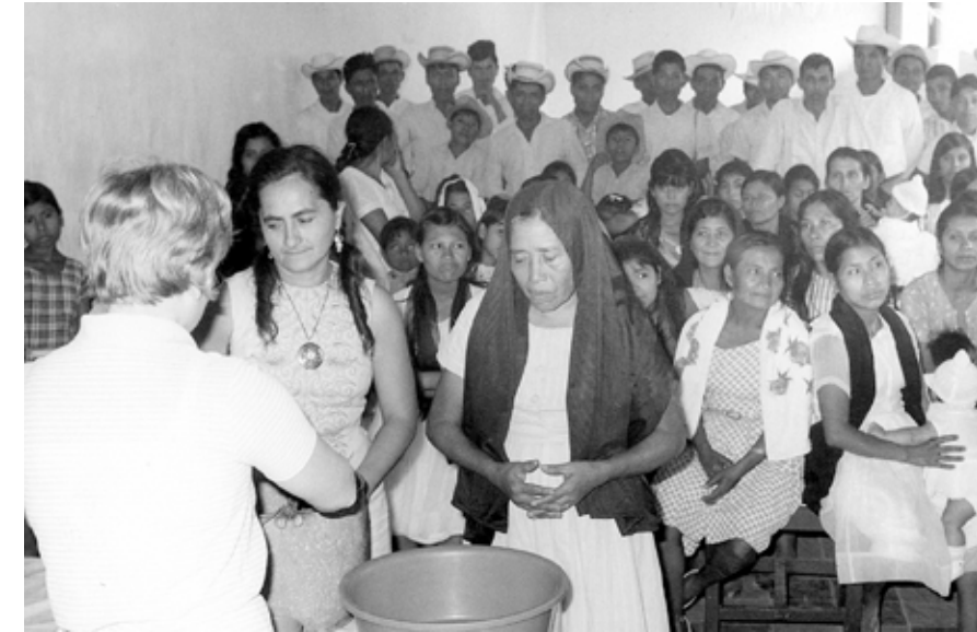
San Jacinto curso básico de cocina para mujeres y hombres (año 1970)