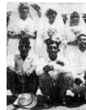
Nunca es tarde para recibir el sacramento del matrimonio: Más de 200 parejas se prometieron amor y fidelidad, en edad muy avanzada, durante el año 1969. La foto puede darnos una idea.