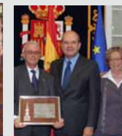
Premio Plaza de España. 2007