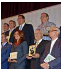
Mención de Honor. Asociación de Fundaciones de Andalucía. 2013