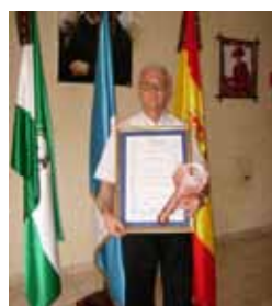
Llave de la Villa de Quezaltepeque (Guatemala). 2007