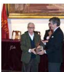
Premio Lux et Veritas. 2011