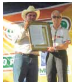
Reconocimiento de la Villa de Quezaltepeque. 2011