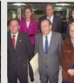
Fundación Banco de Alimentos de Sevilla. 2006