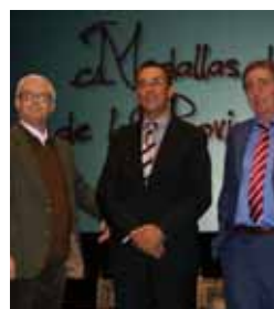
Medalla de Oro de la provincia de Huelva. 2012